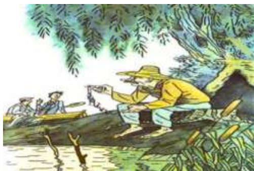
В. Боковня. Малюнок до усмішки «Лебідь»