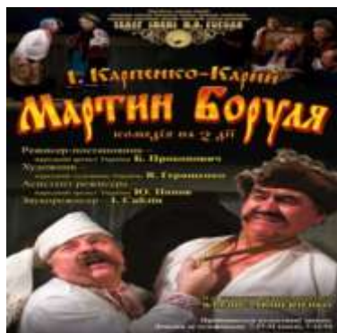
Мартин Боруля. Афіша Полтавського академічного театру ім. М.В. Гоголя