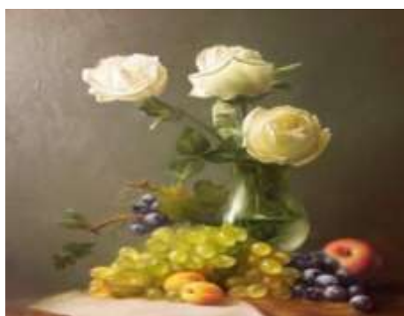
І. Грек «Троянди і виноград»