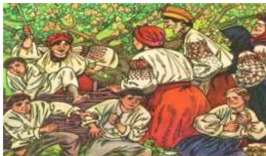
А. Базилевич. Ілюстрації до «Кайдашевої сім'ї»