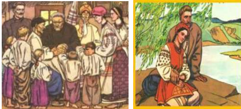
А. Базилевич. Ілюстрації до «Кайдашевої сім'ї»