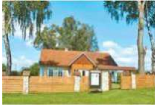
Музей-садиба родини Антоничів. Сучасне фото