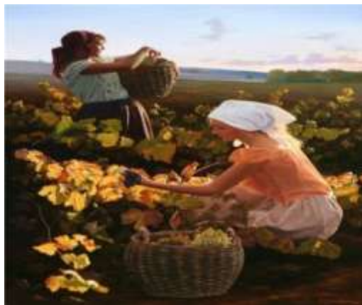
Збір винограду. Фото