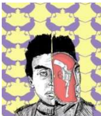
Мал. Андрія Клена «Я йшов у нікуди»