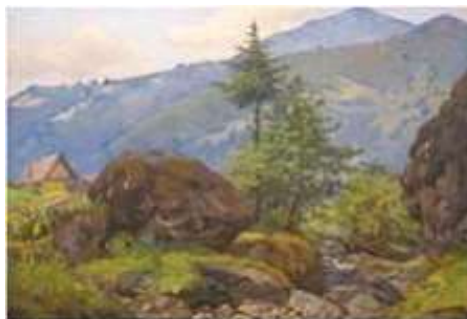
В.Винниченко. «Карпатський пейзаж»