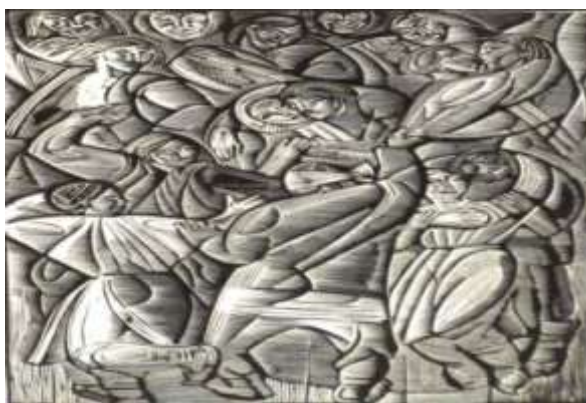
Якутович Г.В. «Тіні забутих предків». Гравюра на дереві