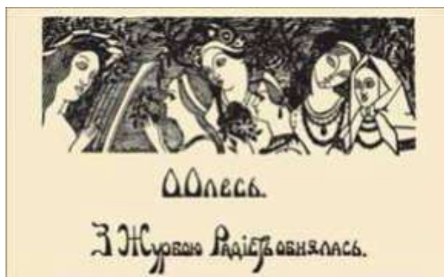
Ілюстрація В. Геншке з обкладинки першої збірки О.Олеся «З журбою радість обнялась»