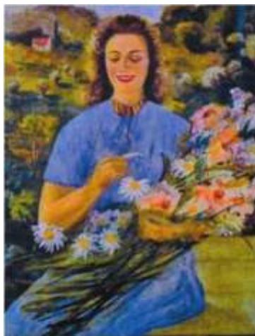
В.Винниченко. «Дівчина з квітами»