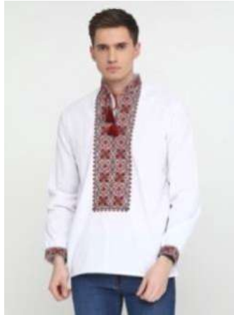
Вишита українська сорочка з орнаментом червоно-чорного кольору з домотканого полотна