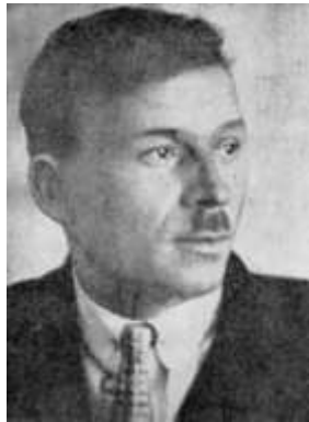
Микола Куліш. Фото