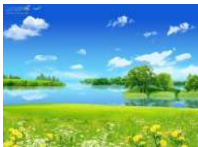
Хмарки біжать - милуюся...