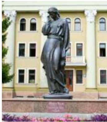
Пам'ятник Марусі Чурай. Полтава