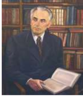
П. Кир'янова. Портрет Юрія Яновського