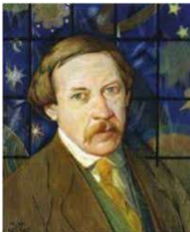
М. Жук. Портрет М.Вороного