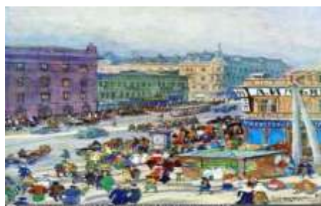
Ілюстрація. «Київський Хрещатик 1918 – 1919 років»