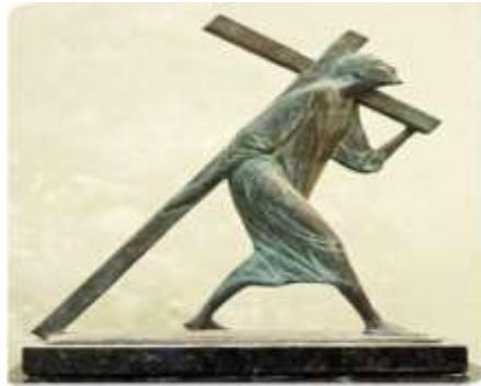
В. Кравцевич. «Несіння хреста»