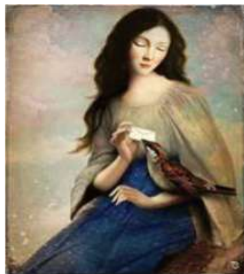
Склоє. «Дівчина і пташка з листом»