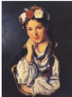
В. Маковський. «Українська дівчина»