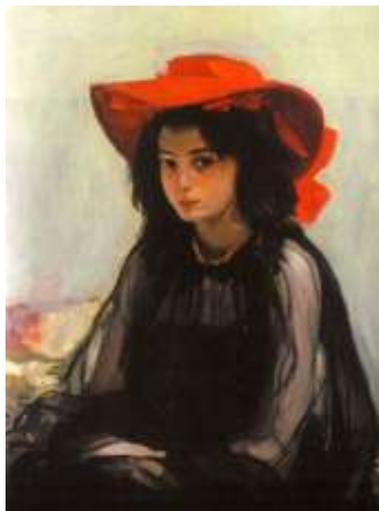
О.Мурашко. «Портрет дівчини в червоному капелюсі»