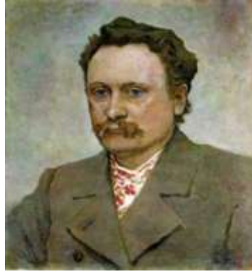
І. Труш. Портрет Івана Франка