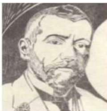
М. Жук. Портрет В. Стефаника