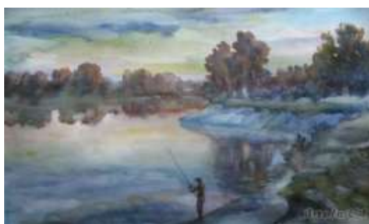
Ю.Ботнар. «Зачарована Десна»