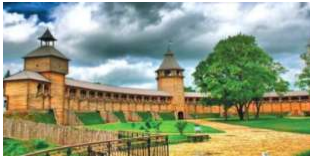
Національний історико-культурний заповідник «Гетьманська столиця» м. Батурін