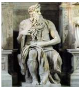
Мікеланджело. «Скульптура Мойсей»