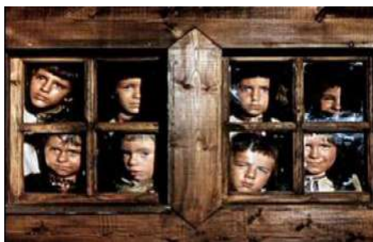
«Тіні забутих предків». Кадр із фільму С.Параджанова