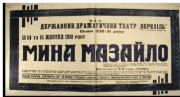
Афіша. Державний драматичний театр «Березіль». 1930р.