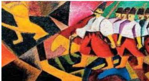
Д. Бурлюк. «Українці»