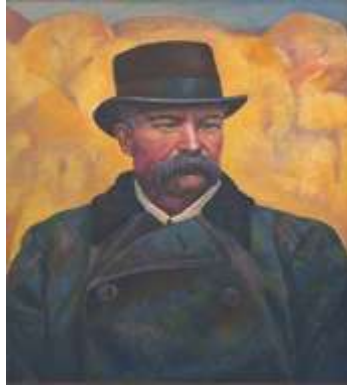
І. Смичек. Портрет Івана Тобілевича (Карпенка-Карого)