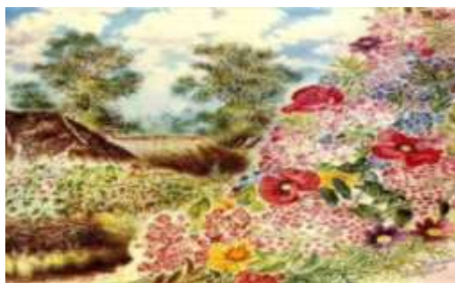
К. Білокур. «Хата в Богданівці»