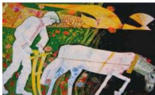
В. Зарецький. «Стус – орач»