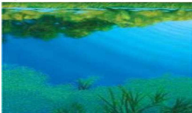
О. Кваша. «Дзеркало ріки»