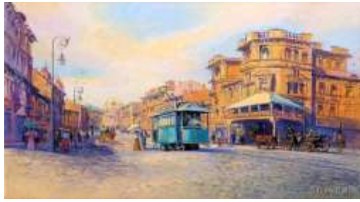
С. Позняк. Старий Київ. Бесарабка. Готель «Національ»