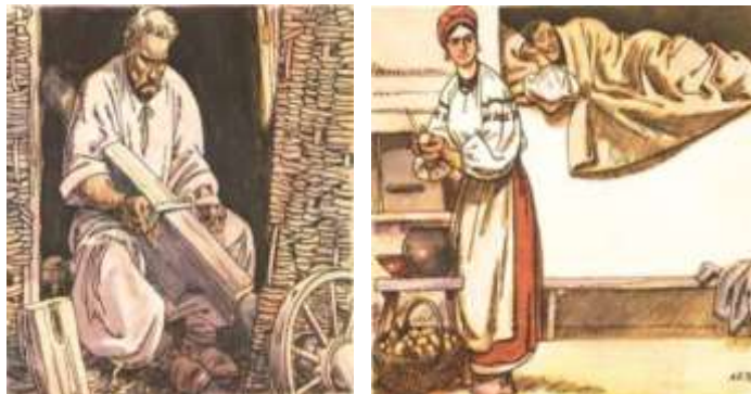
А. Базилевич. Ілюстрації до «Кайдашевої сім'ї»