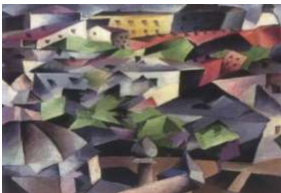
О.Богомазов. «Міський пейзаж. Київ»