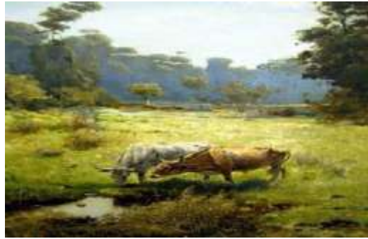
С.Васильківський. «Козача левада»