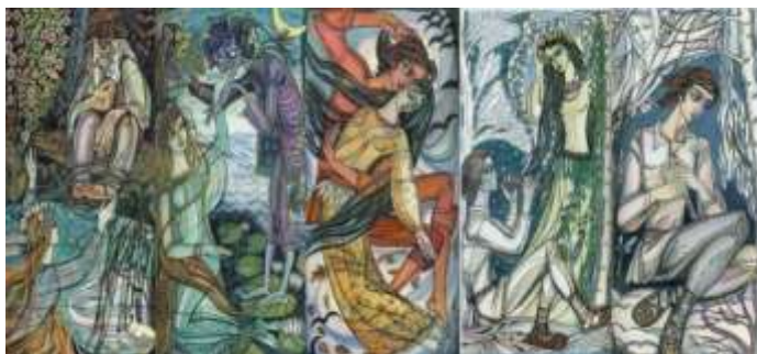
С. Караффа-Корбут. Ілюстрації до «Лісової пісні»