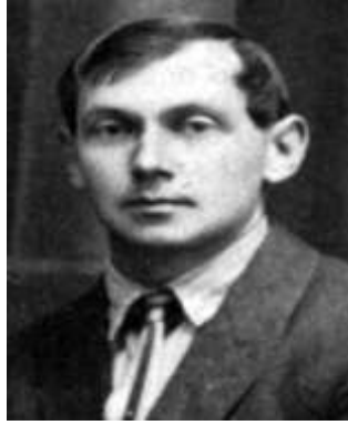
Євген Маланюк. Прага. 1924 р.