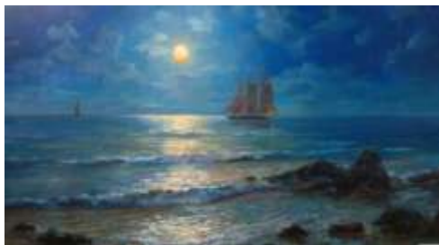
С. Волков «Схід луни. Прибій»