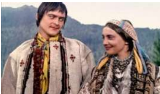
«Тіні забутих предків». Кадр із фільму С.Параджанова