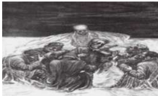
Невідомий автор. Ілюстрація до повісті – поеми О.Турянського «Поза межами болю»