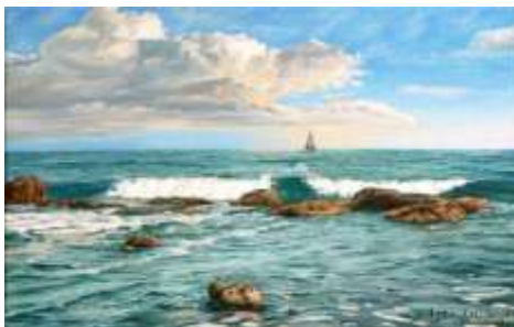
С.Фесенко. «Одеса. Море»