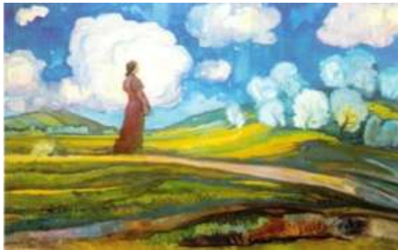
П. Балла. «Стояла я і слухала весну»