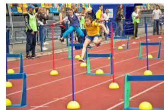
Дитяча легка атлетика