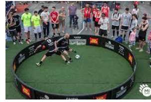
Панна (вуличний футбол)

Радимо враховувати ефективність наскрізного проведення фізичної підготовки, яке спирається на застосування вправ для розвитку різних фізичних якостей в кожному уроці протягом навчального року. Темп виконання, амплітуду, кількість повторень учні та учениці регламентують самостійно у відповідності до свого поточного стану.